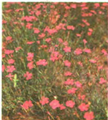
400. Гвоздика дельтоїдна.